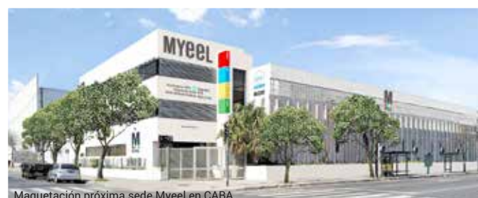
Maquetación próxima sede Myeel en CABA